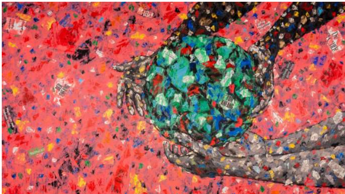
Das Misereor-Hungertuch 2023 „Was ist uns heilig?“ von Emeka Udemba. - © Misereor

Während der Fastenzeit von Aschermittwoch bis Ostern - mit ihrem Höhepunkt am 5. Fastensonntag - findet die zentrale Jahresaktion des Hilfswerkes Misereor statt. Die Fastenaktion steht jährlich unter einem anderen Leitwort und rückt damit ein Land des globalen Südens und ausgewählte Projektpartner Misereors in den Fokus. 2023 ist es Madagaskar mit dem Leitwort Frau. Macht. Veränderung.